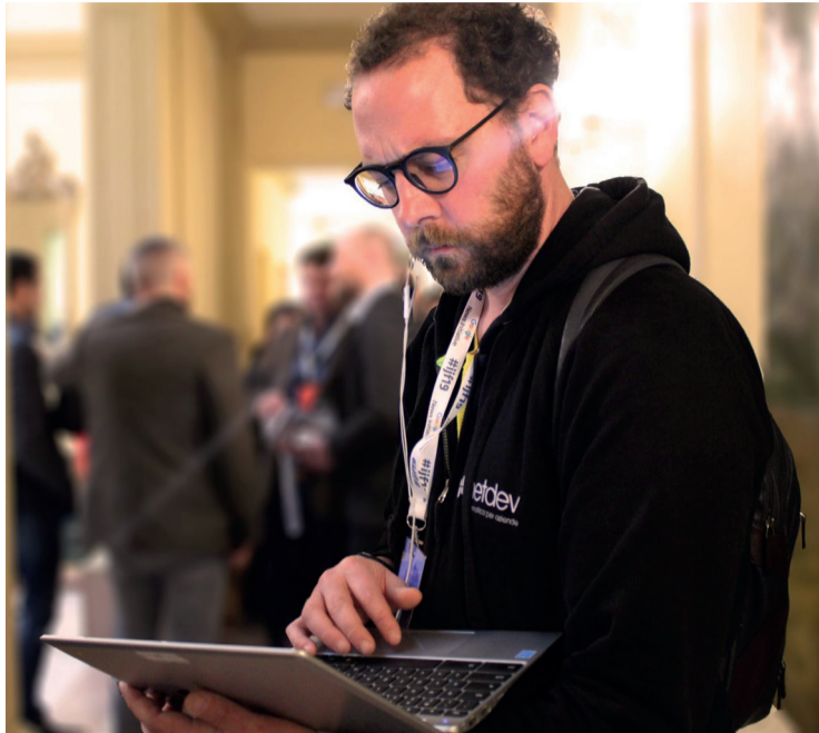
Uno degli addetti ai lavori dell'azienda all'opera

nel settore delle telecomunicazioni e dell'Information Technology, e può quindi contare su personale altamente specializzato.