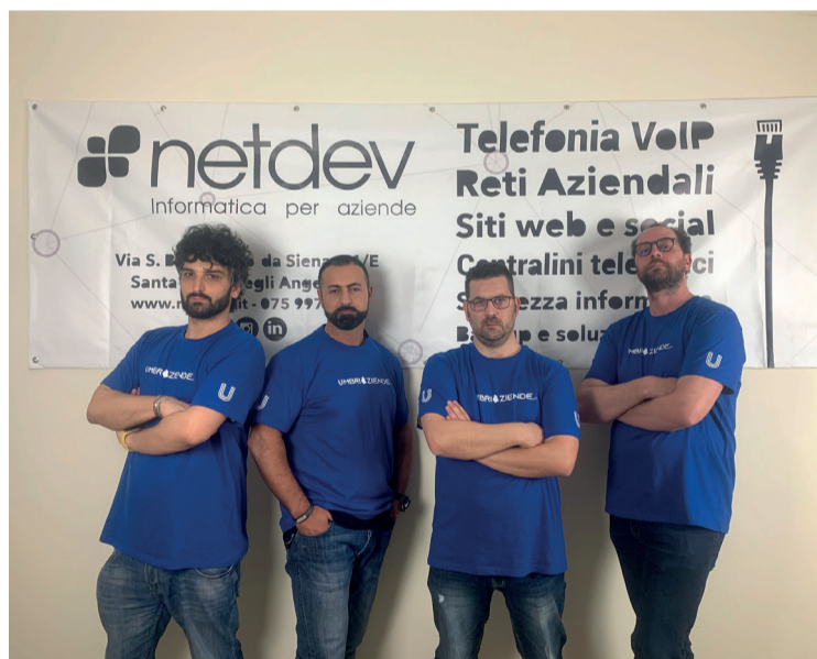
Il team della società attiva nel campo dell'informatica